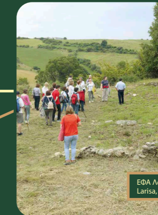
ΕΦΑ Λάρισας, 2023 Larisa, 2023