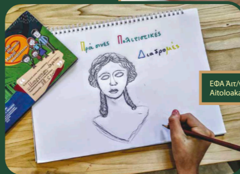
ΕΦΑ Αιτωλίας & Λευκάδας, 2022 Aitolioakarnania & Lefkada, 2022