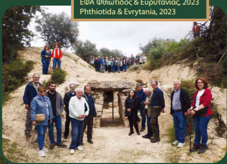
ΕΦΑ Φθιώτιδος & Ευρυτανίας, 2023 Phthiotida & Evrytania, 2023