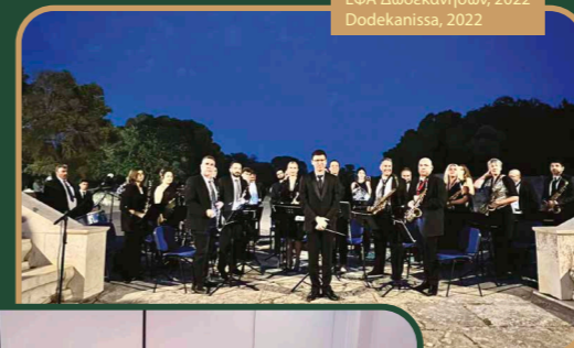
ΕΦΑ Δωδεκανήσων, 2022 Dodekanissa, 2022